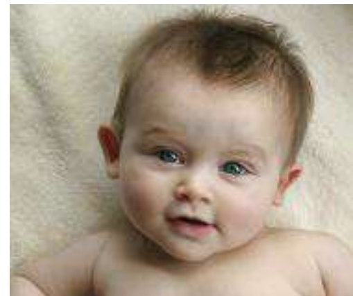
NACIMIENTO HASTA LOS AÑOS

Intervención Temprana | Elegibilidad | Acceso a Servicios de Intervención Temprana | Servicios | Transición a la Preprimaria | Contribución Financiera |